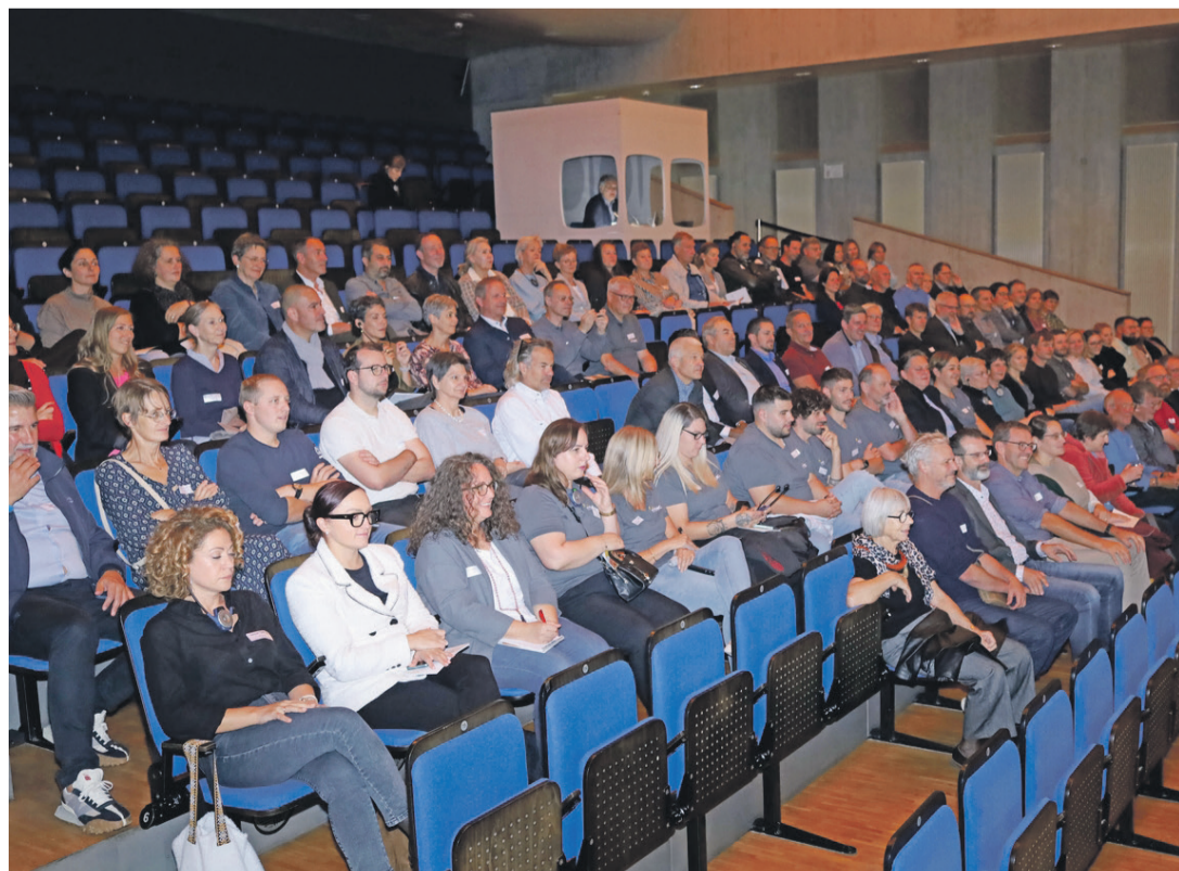
Mitarbeitende, Partner und Kundinnen hatten anlässlich des Jubiläums die Gelegenheit, sich auszutauschen.

Redaktion «Der Soziale Weg» dersozialeweg@cskartell.ch